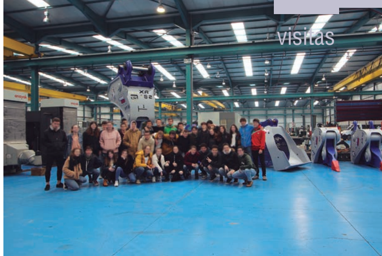
Los dos grupos de alumnos que realizaron la visita junto a algunas de nuestras máquinas terminadas en el taller.