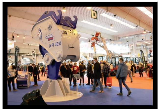
El Xcentric Ripper XR122 despertó mucho interés y asombro entre los asistentes.