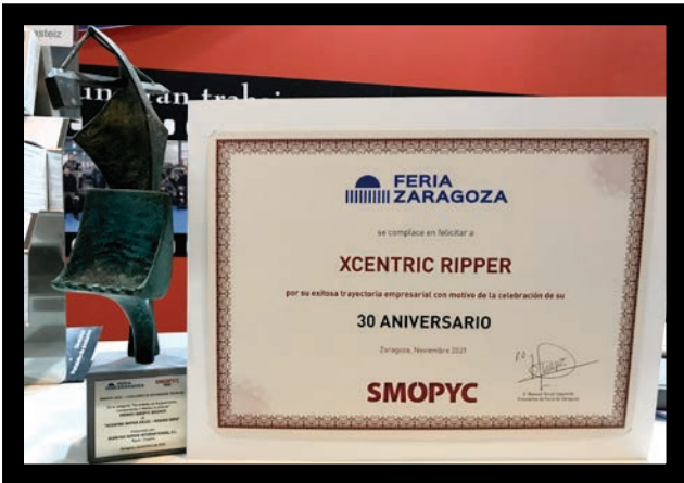
Premio otorgado al XR122, junto al diploma por el 30 aniversario de Grado Cero.