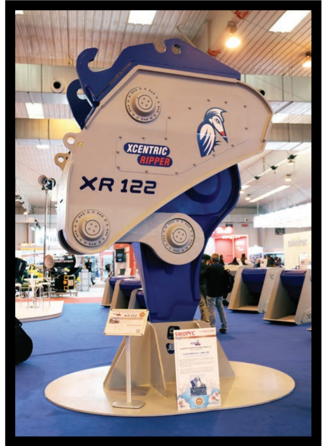
Xcentric Ripper XR122 junto al cartel proporcionado por la organización, con la información del premio.