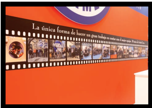
Mural en el stand con fotos de trabajadores, para conmemorar los 30 años de Grado Cero.

Personal de Xcentric y Grado Cero junto a distribuidores de España, Francia, India y personal de ALLU.