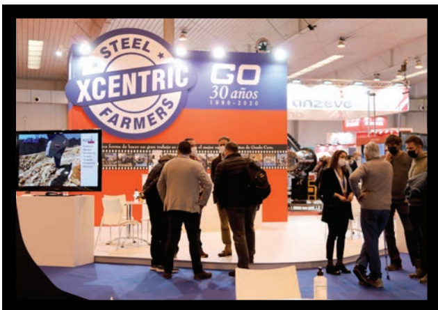
Hubo jornadas con mucha afluencia de público.