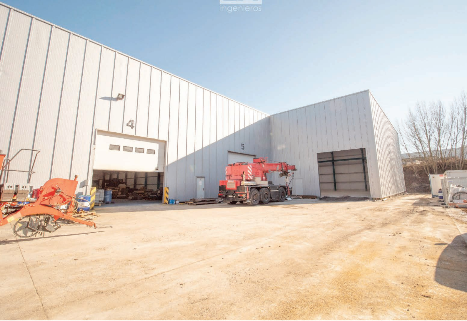
Zona donde se ha anexionado el nuevo pabellón.