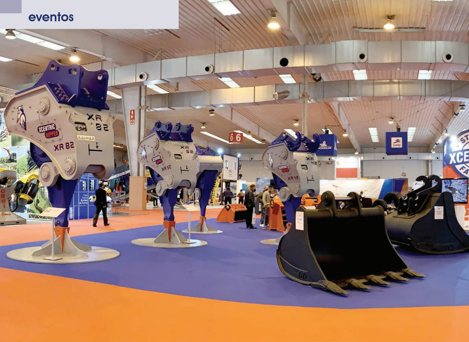
Stand de Xcentric / Grado Cero durante la Feria SMOPYC 2021.