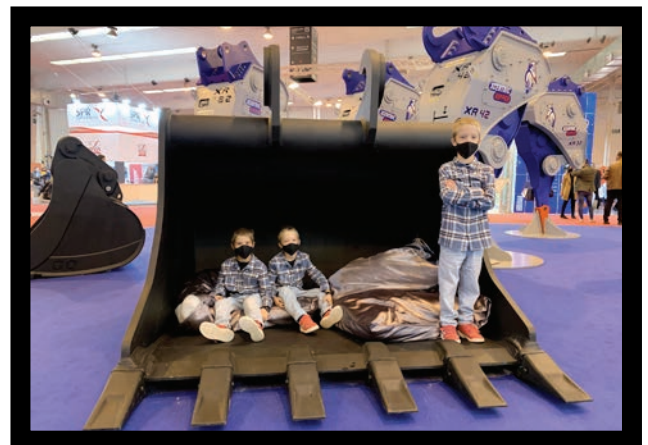
Los más pequeños también pudieron disfrutar en nuestro stand.