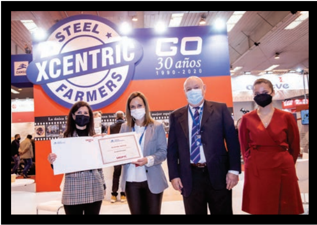
Momento de la entrega del diploma conmemorativo por el 30 aniversario de Grado Cero.