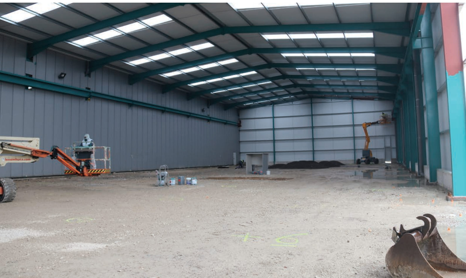
El nuevo pabellón durante las obras, aún sin asfaltar.