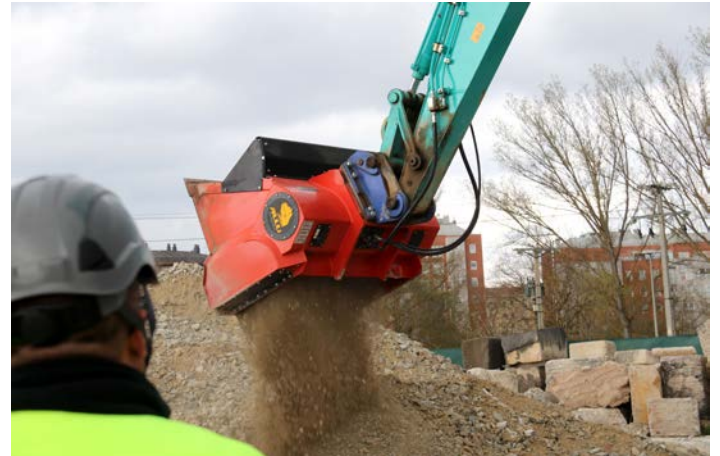
Demostración del ALLU Transformer en una planta de reciclaje.