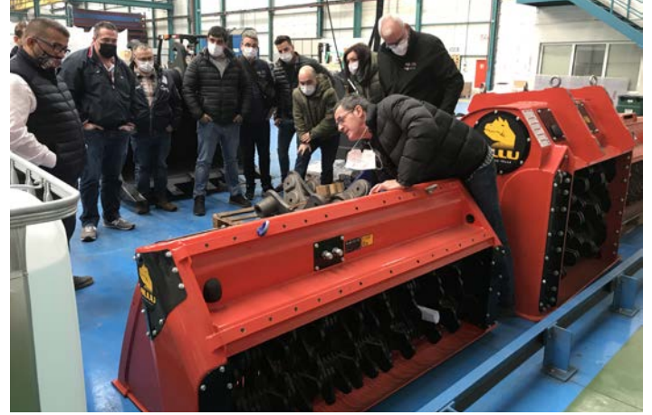
Inspección física de los cazos cribadores en el taller.