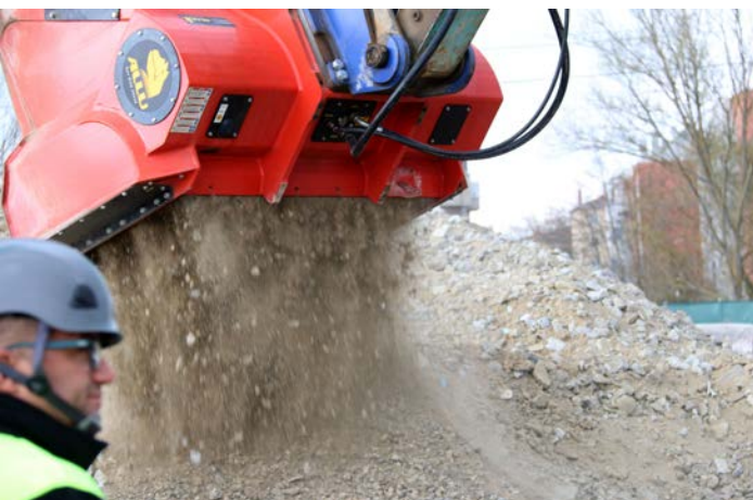
Prueba de la gran productividad de este implento.