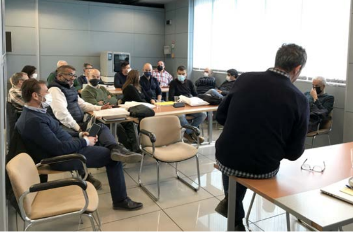
Arranque de la jornada, con presentación, explicación del producto y ronda de preguntas para resolver dudas.