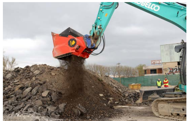
Demostración del ALLU Transformer con otro material.

por ello, que tanto Grado Cero como ALLU, llevan años investigando y desarrollando nuevos implementos que, además de sus aplicaciones habituales, le aporten al cliente esa capacidad para poder reciclar los materiales generados, además de reducir consumos de combustibles, costes de transporte, etc.