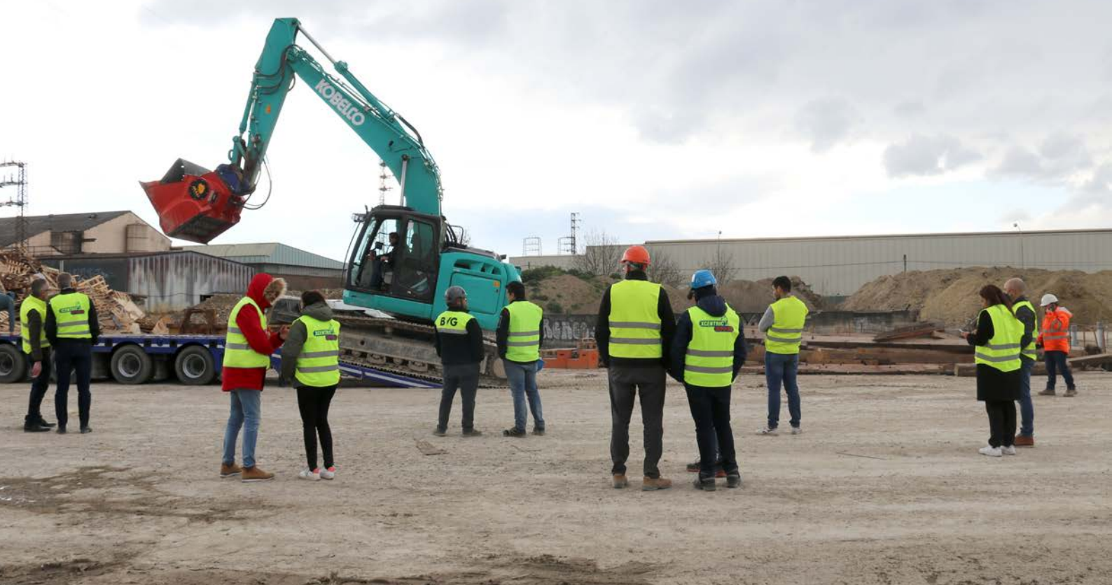
Distribuidores de España durante la demostración con el ALLU Transformer en una planta de reciclaje en Vitoria-Gasteiz.