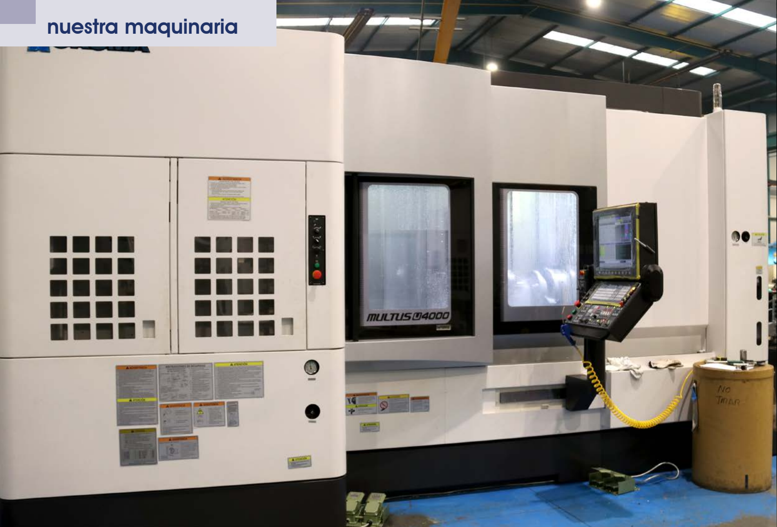
Segundo torno multitarea de la marca Okuma, modelo MULTUS U400, recientemente incorporado en el taller de mecanizado.