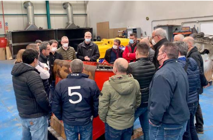
Formación técnica sobre instalación y mantenimiento, en el taller de Grado Cero.