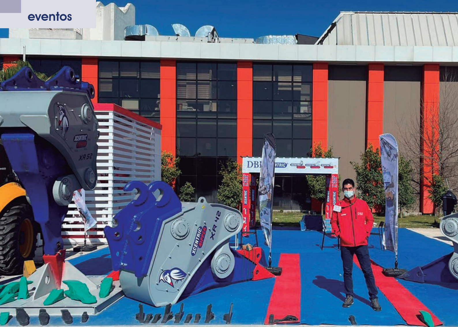
Stand de DBF Limited, distribuidor de Xcentric en Turquía, durante la feria KOMATEK 2022.