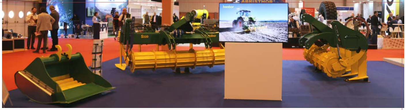
Zona dedicada a la nueva marca “baabor” dentro del stand de Xcentric y Grado Cero, con el cazo criba lobular y dos de los modelos de subsolador, el S320 y el SR320.