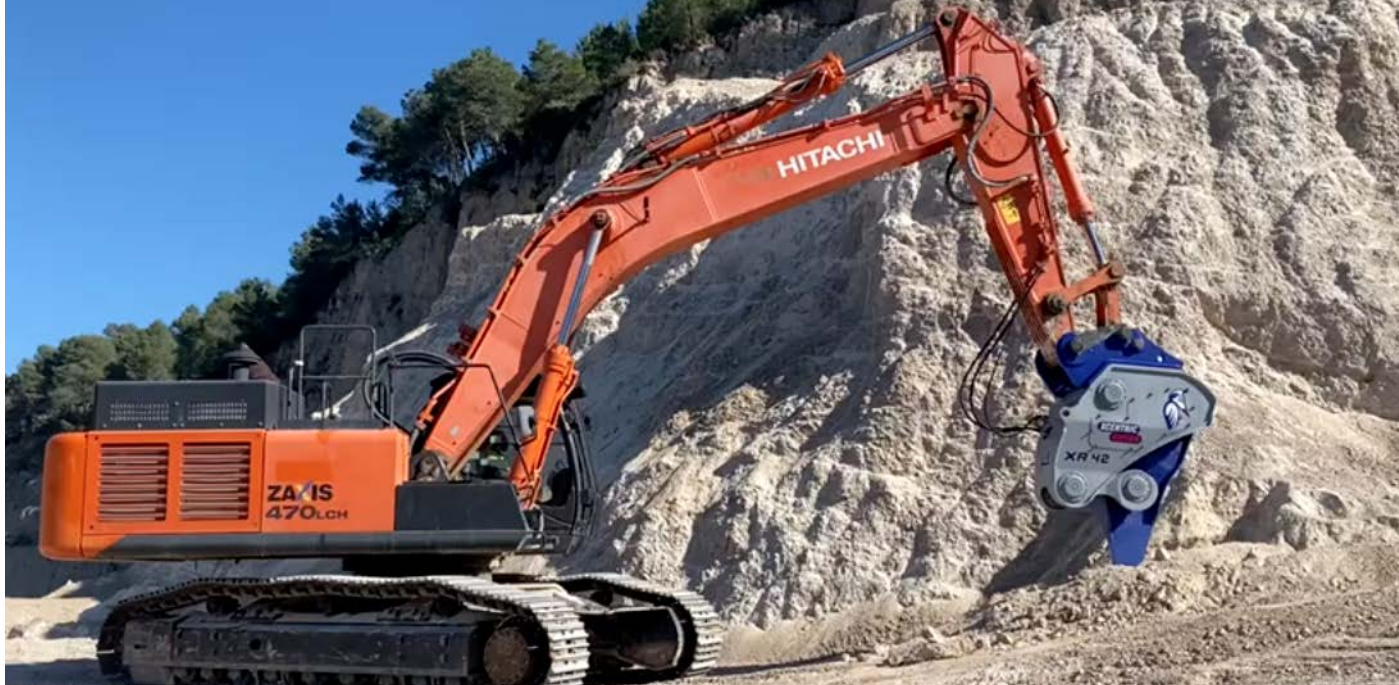
Puesta en marcha de un Xcentric Ripper XR42 vendido por TRUCKMA.

COMERCIAL TRUCKMA, S. L. son los distribuidores de Xcentric en la Comunidad Valenciana. Ellos mismos nos cuentan la historia de la empresa y su relación con Xcentric.