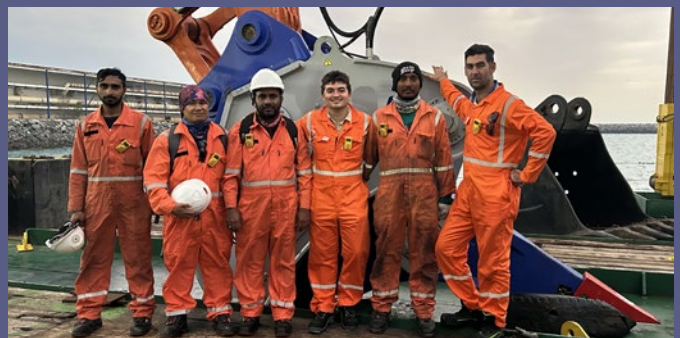
Nuestro equipo administrativo y técnico en Catar Ras Laffan, con los equipos de Alhassanain y McDermott, entrega del XR82

Felicito a Xcentric Ripper en su 15° aniversario y a todos los que han hecho esto posible. ¡Estamos listos para más éxitos juntos!